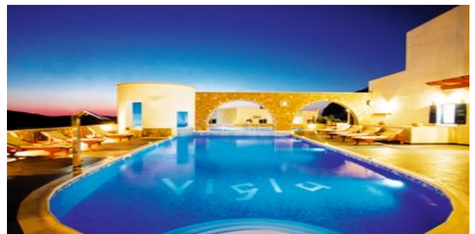
Der Pool des Vigla Hotels