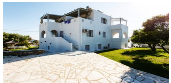
Blick auf die Evi Rooms