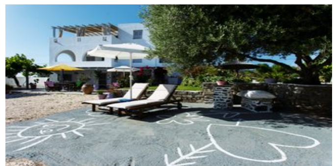
Die Evi Rooms