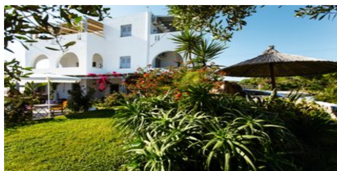
Das Hotel Evi Rooms