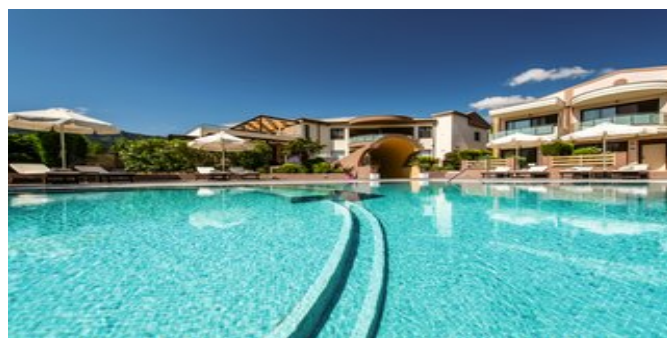
Alexandra Golden Boutique