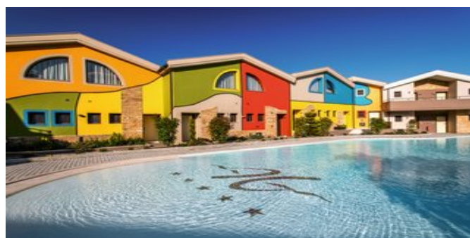
Alexandra Golden Boutique