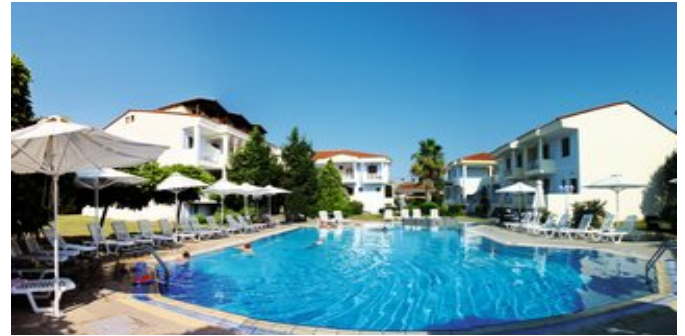
Blick auf den Pool und die Anlage