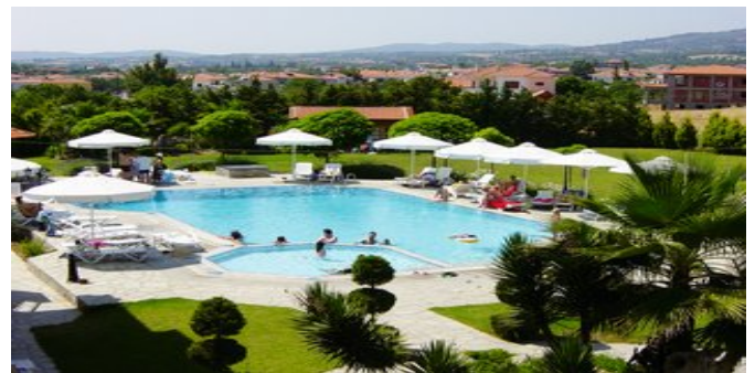
Blick über die Anlage und den Poolbereich