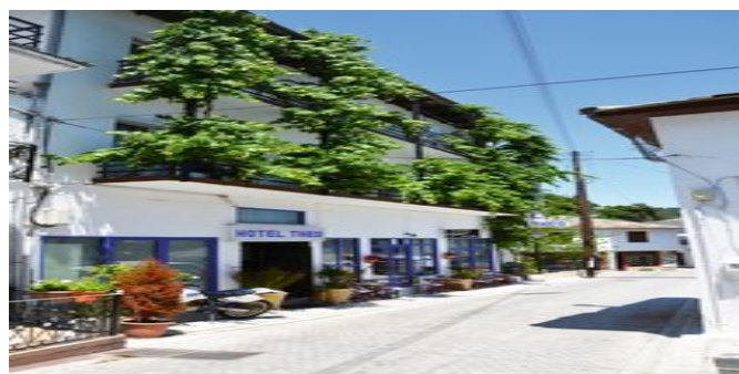
Das Hotel Theo