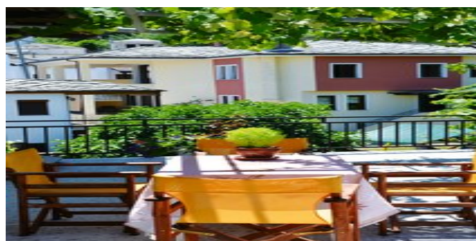
Blick von der Terrasse