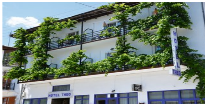
Das Hotel Theo auf Thassos