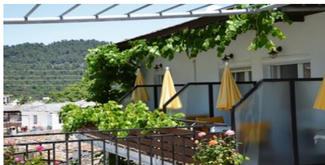
Blick auf die Balkone