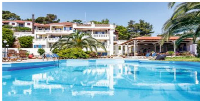
Das Stafylos Suites Boutique Hotel

POOLBEREICH Süßwasserpool mit Liegen, Sonnenschirmen und Pooltüchern. Cafébar.