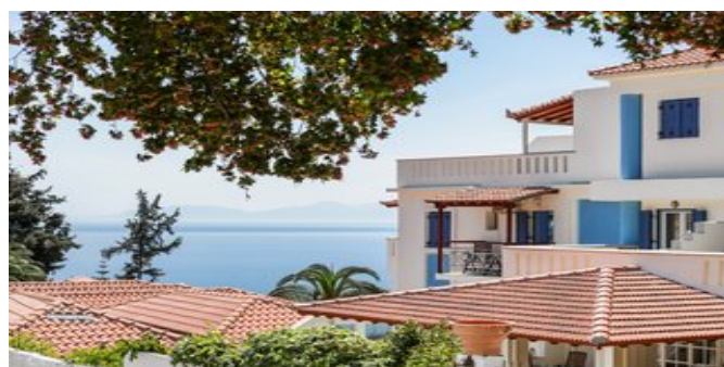
In der Anlage