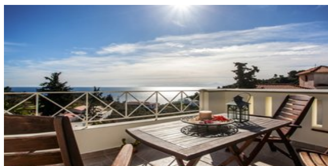
Ausblick vom Balkon