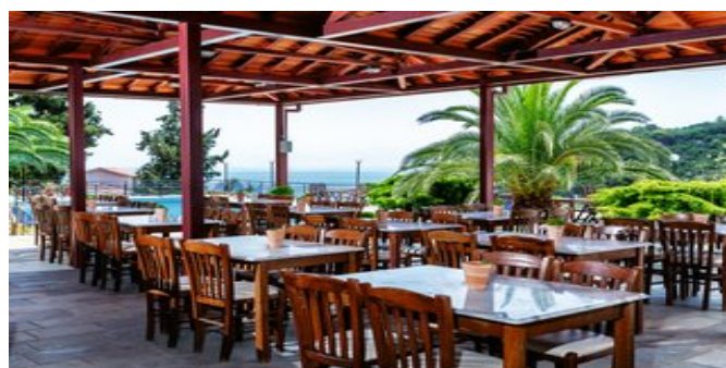
In der Cafébar