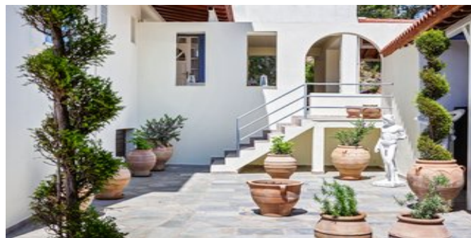
In der Anlage