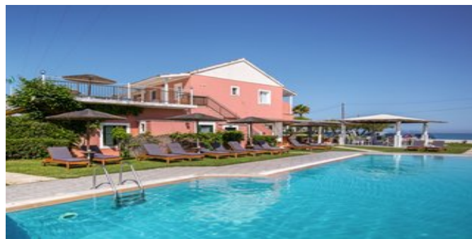
Die Anlage mit Pool

ATTIKA SERVICE Deutschsprachige Reiseleitung.