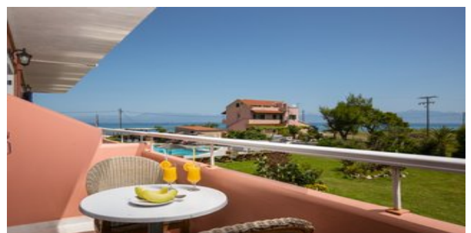
Auf dem Balkon