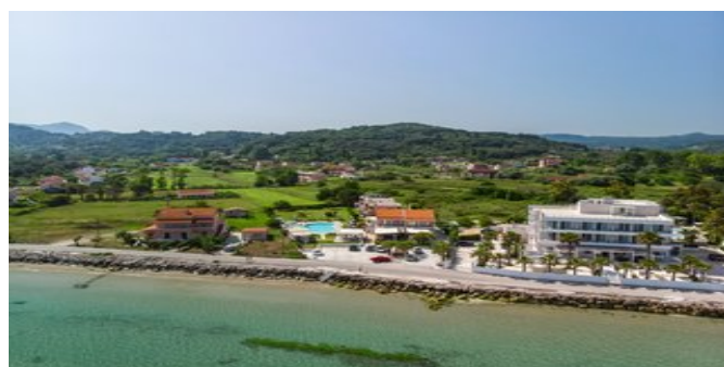
Blick auf die Anlage