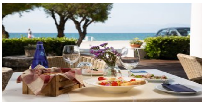
Auf der Restaurantterrasse