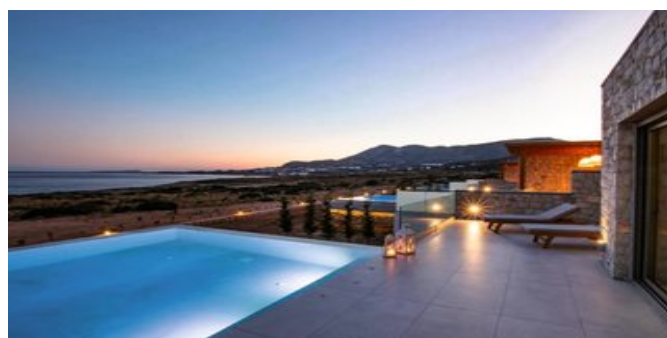
An einem der privaten Pools