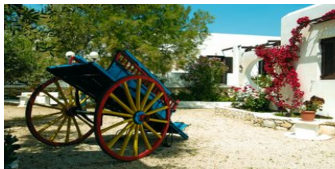
In der Anlage