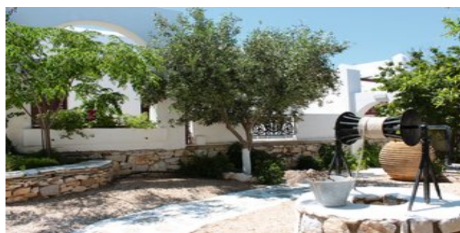
In der Anlage