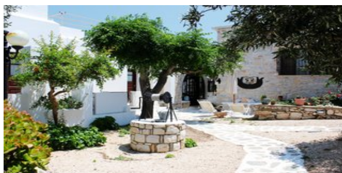
In der Anlage