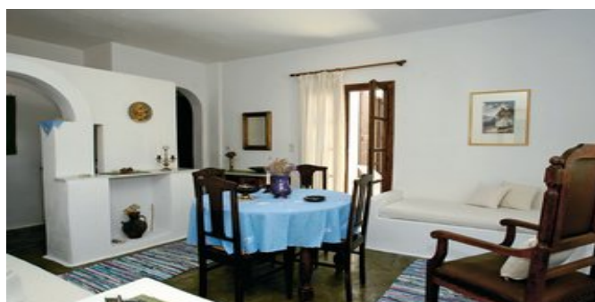
Wohnbeispiel Appartements D