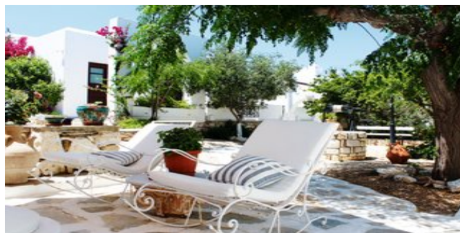
In der Anlage