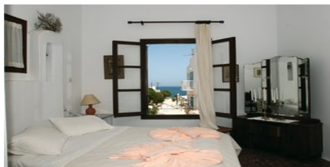
Wohnbeispiel Appartements C