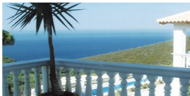
Blick von der Anlage