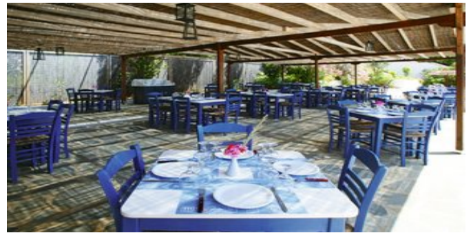
In der Taverne