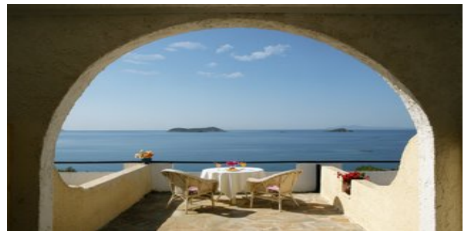
Den Ausblick genießen