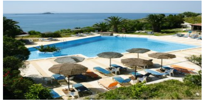
Blick auf den Poolbereich

ATTIKA SERVICE Telefonische Betreuung durch deutschsprachige Reiseleitung. Fähr-/Landtransfer bei Pauschalreise inklusive.