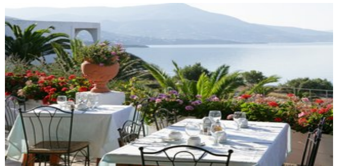
Auf der Terrasse