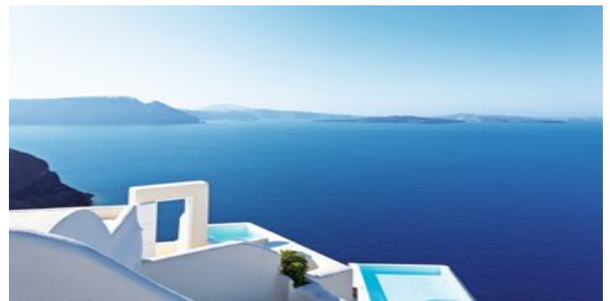
Blick von der Anlage