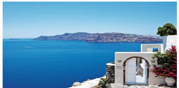
Die Canaves Oia Suites