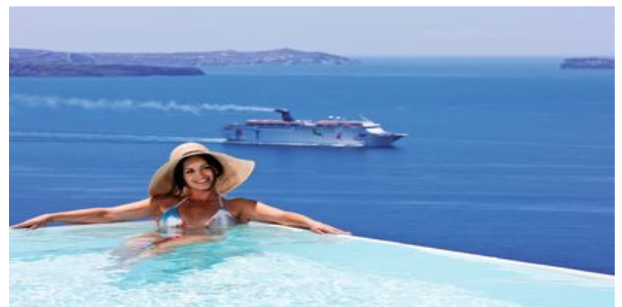
Wohnbeispiel Honeymoonsuite mit Jacuzzi