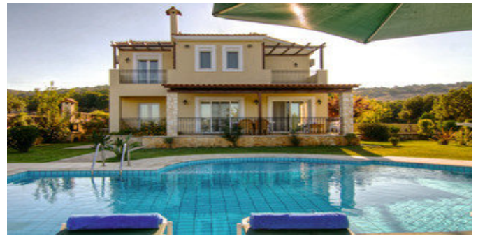
Eine der Villen mit Pool

ATTIKA SERVICE Taxitransfer bei Pauschalreise inklusive.