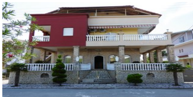
Die Studios Andreas