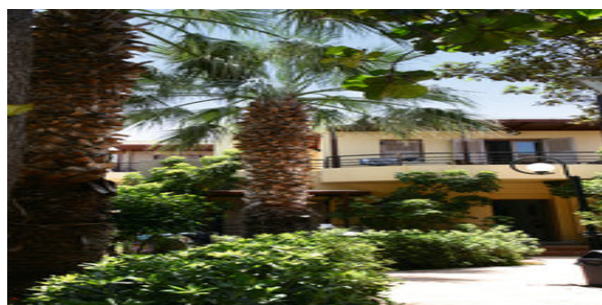
Die Anlage Latania