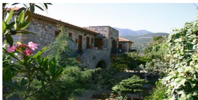
Die Appartements Vardia