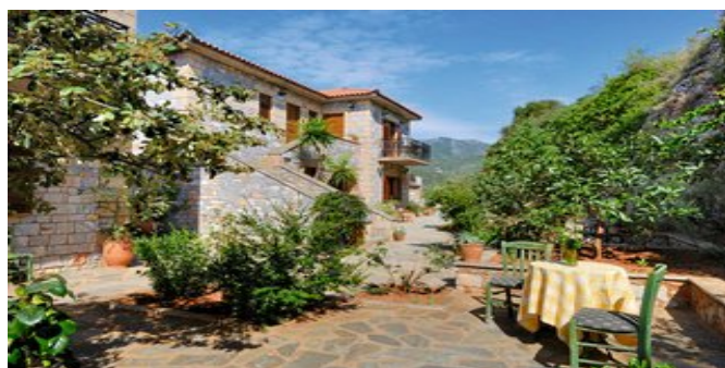
Die Appartements Vardia