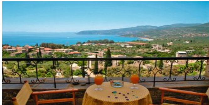
Blick vom Balkon

ATTIKA SERVICE Deutschsprachige Reiseleitung. Taxi-Transfer bei Pauschalreise inklusive.