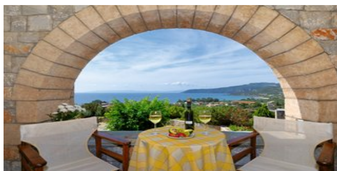
Auf dem Balkon