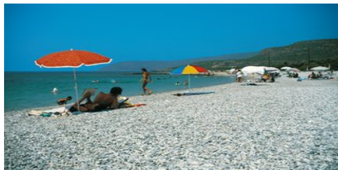
Strand bei Kardamíli