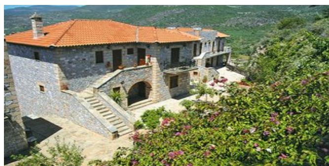
Die Appartements Vardia