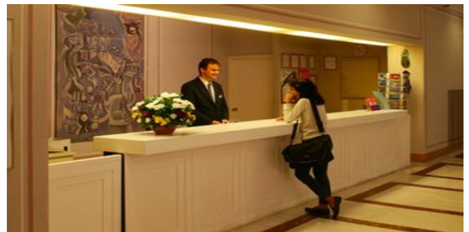
An der Rezeption