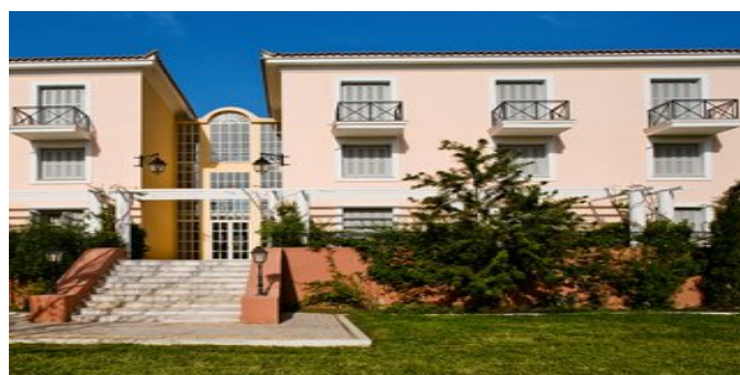
Das Hotel Amalia Nauplia