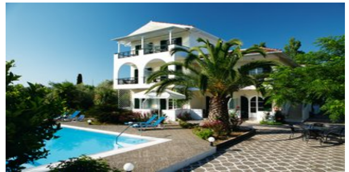
Die Anlage Villa Marina