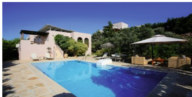
Die Villa mit Pool