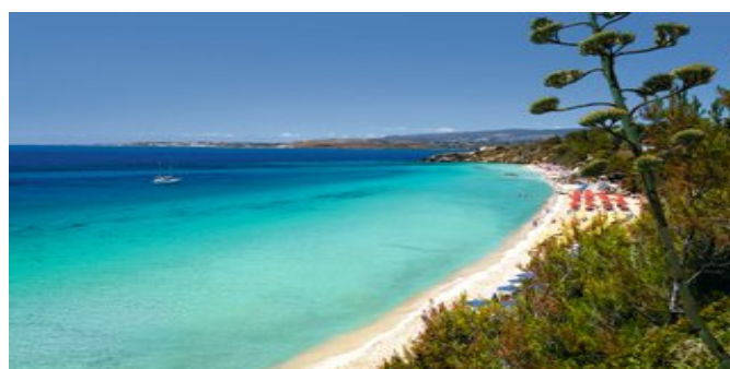
Platí Gialós - Strand