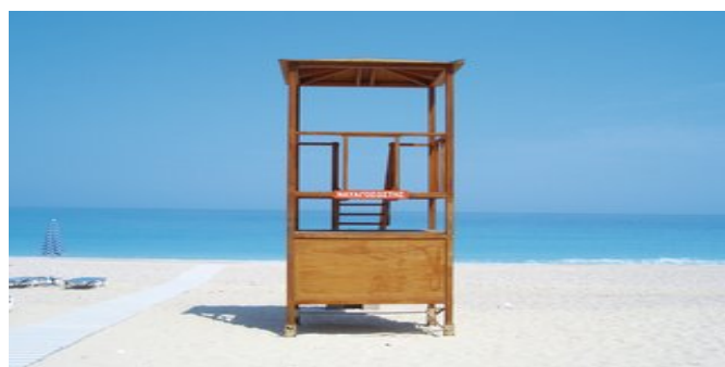
In der Myrto-Bucht