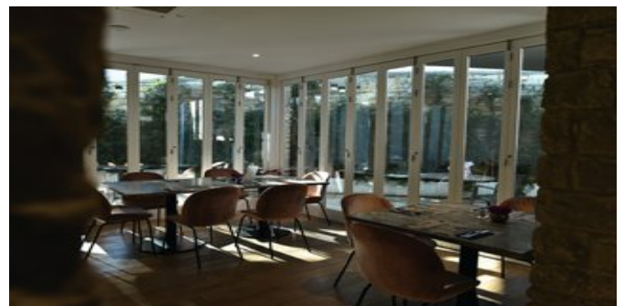
Im "Loyalty" Restaurant