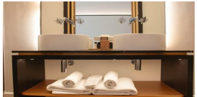
Wohnbeispiel Standard Zimmer