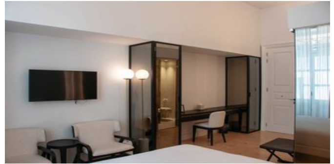
Wohnbeispiel Standard Zimmer