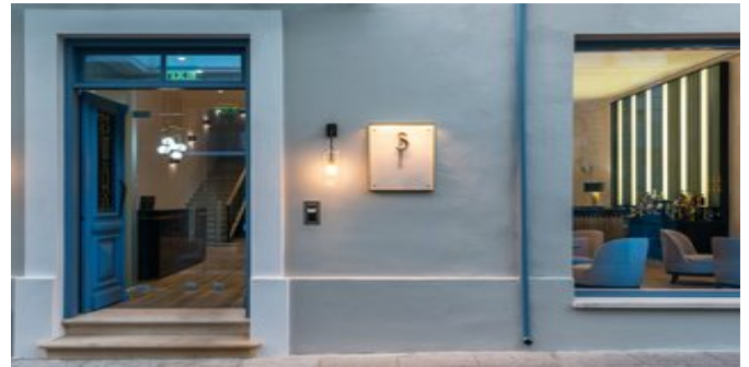
Das Sir Paul Hotel