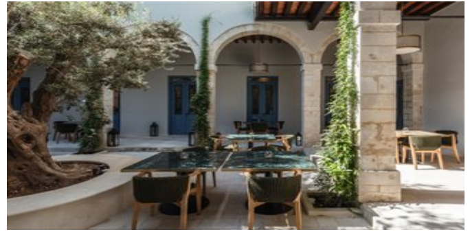
Das "Atrium" Restaurant im Innenhof

DE LUXE ZIMMER (RB) Ca. 22 qm. Grundausstattung wie die Zimmer, jedoch größer und mit eleganten Details gestaltet. En-suite Bad oder Dusche/WC, Föhn, Pflegeprodukte. Balkon mit Sitzgelegenheit und Blick zur Landseite oder zum Innenhof.