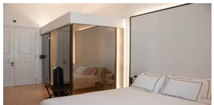
Wohnbeispiel Standard Zimmer