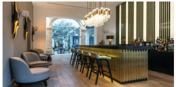
Die "Lux" Bar