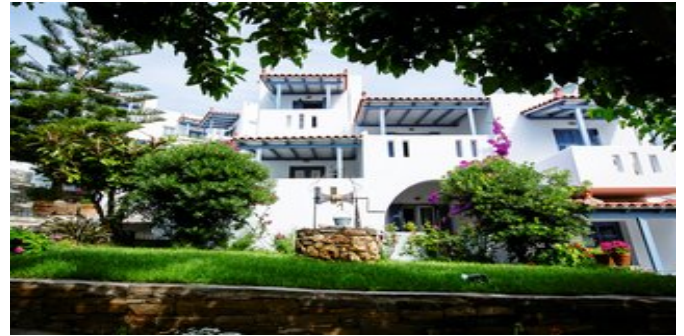
Die Studios Irene

HOTELCHARAKTER Ein idealer Ausgangspunkt für Wanderungen durch den landschaftlich reizvollen Inselsüden. Karten und Informationen