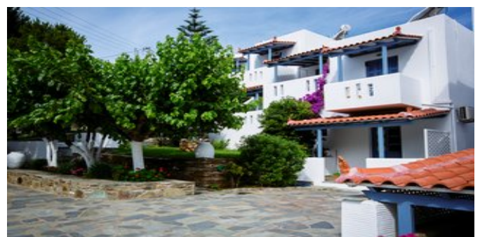
Die Studios Irene