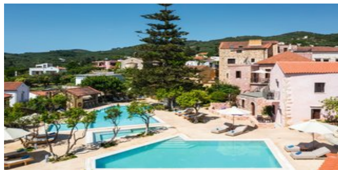
Die Anlage mit Pool

SUPERIORZIMMER (RB) Grundausrüstung wie die Zimmer, jedoch geräumiger, mit Schlafcouch für eine 3. Person. Bad oder Dusche/WC, Föhn. Balkon oder Terrasse (teils Gemeinschaftsterrasse).