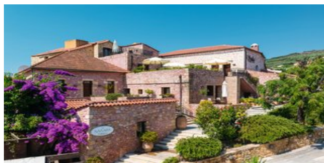
Das Hotel Spilia Village