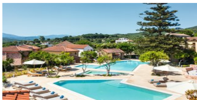
Blick auf den Poolbereich