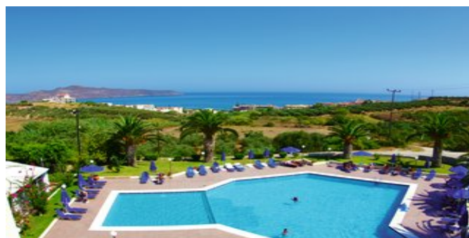
Blick über den Poolbereich