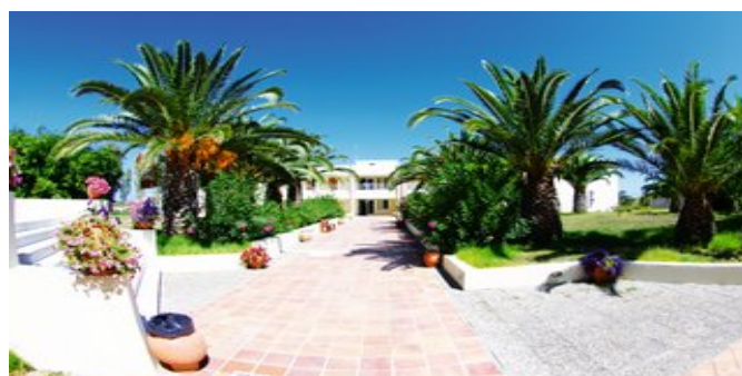
In der Hotelanlage