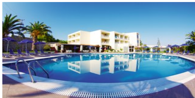
Das Hotel Eleftheria

STRAND Schöner, weitläufiger Sandstrand mit Liegen und Sonnenschirmen (gegen Gebühr).