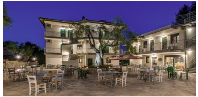
Das Mirabilia Boutique Hotel