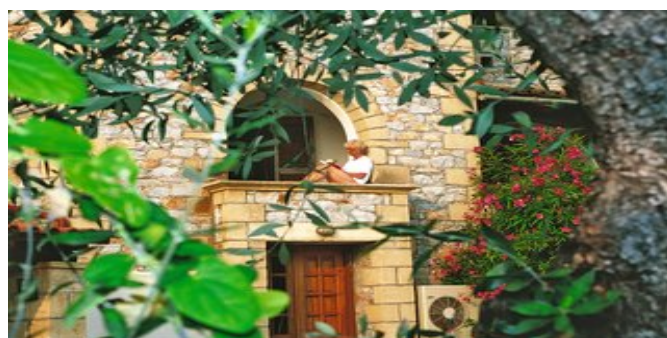
Zeit zum Entspannen