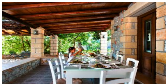
Terrasse und Aufenthaltsbereich