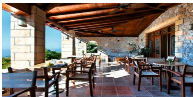
Terrasse mit Möglichkeit im Freien zu Frühstücken