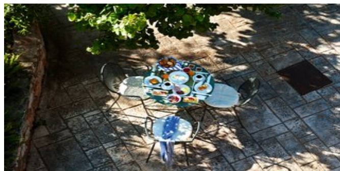
Garten mit Sitzecke

Website: www.attika.de E-Mail: verkauf@attika.de