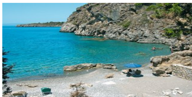
Die Badebucht beim Hotel