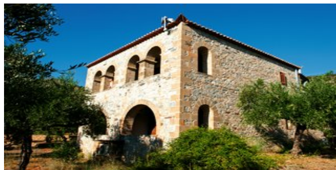
Außenansicht der Ferienanlage

APPARTEMENTS (AA) Ca. 60 qm. Für 4 Erwachsene und 2 Kinder. Lage im 1. Stock in einem der Nebengebäude. Grundausrüstung wie die Zimmer. Großzügiger Wohn-/Schlafraum mit Schlafmöglichkeit für 2 Kinder und Kochnische (für die Zubereitung von Kleinigkeiten). Zwei separate Schlafzimmer, jeweils mit Doppelbett. Bad/WC. 3 Balkone mit Blick zur Landseite oder seitlichem Meerblick.