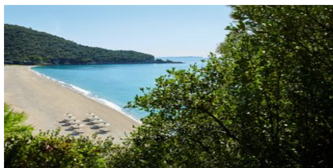
Der Karavostasi Strand