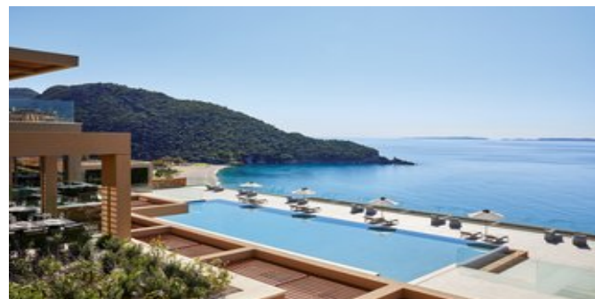
Blick auf den Pool und das Meer

SUPERIORZIMMER (RB) Ca. 28-30 qm. Geschmackvoll und komfortabel, in warmen Naturtönen eingerichtet. Klimaanlage, Telefon,