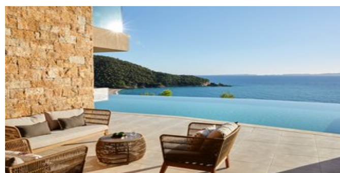
Wohnbeispiel Juniorsuiten Panorama