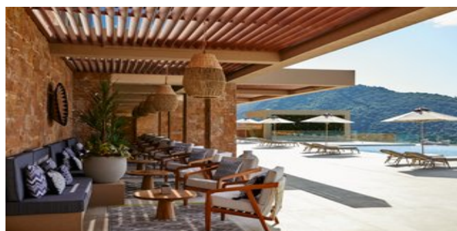
Das "Indigo" Strand-Restaurant