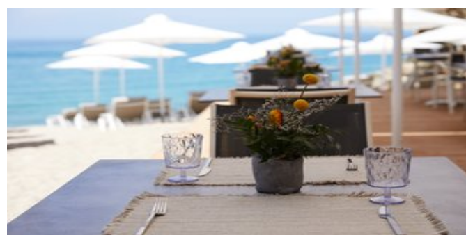
Das "Azure" Pool Restaurant