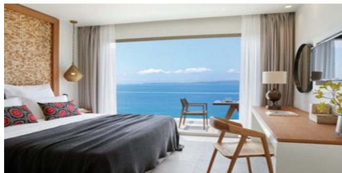
Wohnbeispiel One Bedroom Familiensuiten

AKTIVITÄTEN / SPORT Ohne Gebühr: Tennisplatz (Flutlicht gegen Gebühr), Yoga,