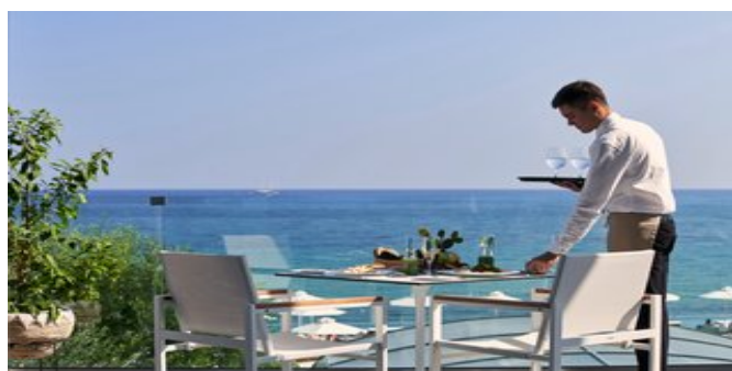
Im "Gaia" Hauptrestaurant