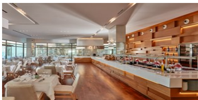
Das "Gaia" Hauptrestaurant