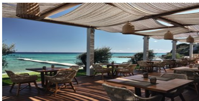
Das "Almyra Beach House"