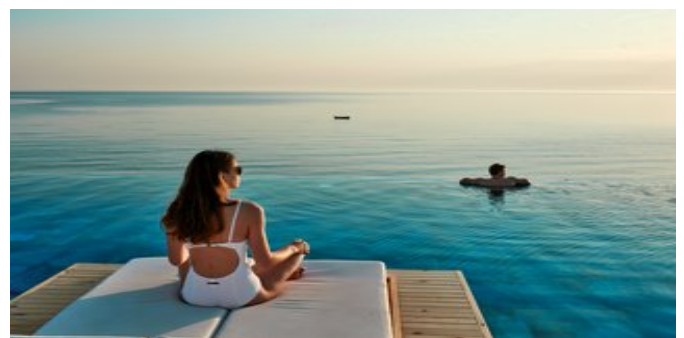
Am Infinity Pool