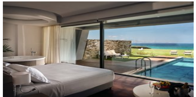
Wohnbeispiel Deluxe Suiten