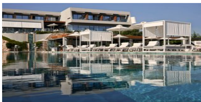
Das Lesante Blu Exclusive Beach Resort