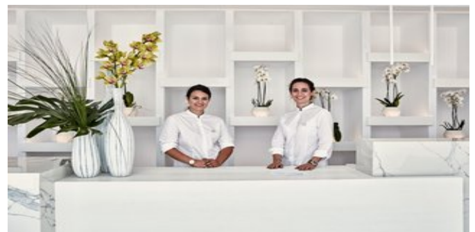
An der Rezeption