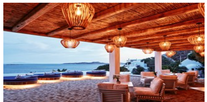
Im "Mikrasia" Restaurant