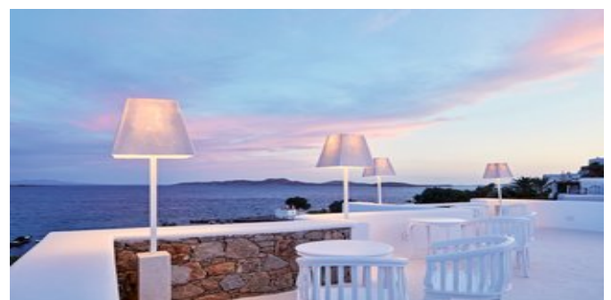
Blick auf das Meer