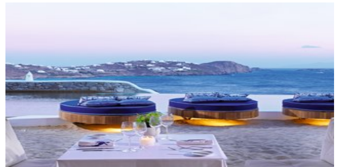
Die Terrasse des "Mikrasia" Restaurants