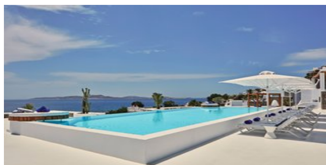
An einem der Pools