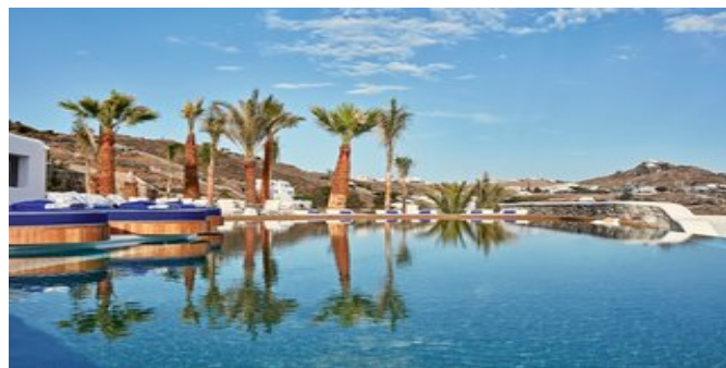
Einer der Pools

VERPFLEGUNG ÜF (reichhaltiges authentisch kykladisches Frühstück à la carte, das von einem Michelin-Sternekoch aus frischen lokalen Zutaten