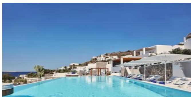
Einer der Pools