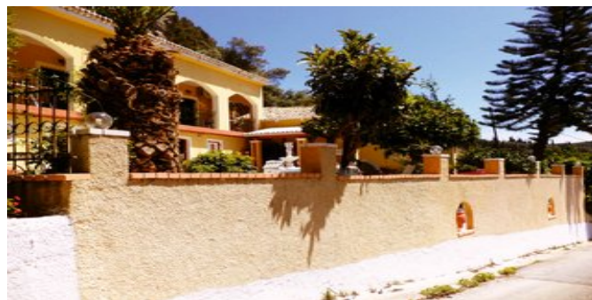
Die Appartements Vassilis

ATTIKA SERVICE Deutschsprachige Reiseleitung. Taxi-Transfer bei Pauschalreise inklusive.