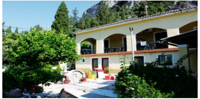
Die Appartements Vassilis