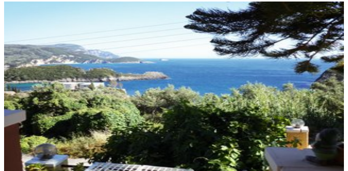
Blick von der Anlage