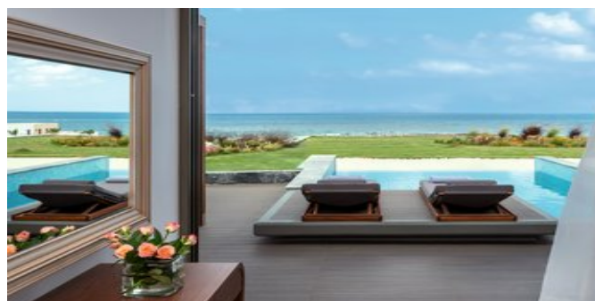
Wohnbeispiel Premium Energy Suiten