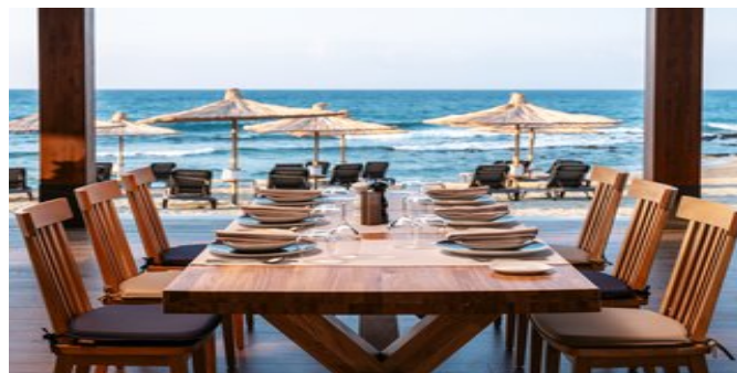
Im À-la-carte-Restaurant "Eternal Blue"

UNTERHALTUNG Im benachbarten Schwesterhotel "Nana Golden Beach":