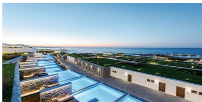
Blick über die Anlage auf das Meer