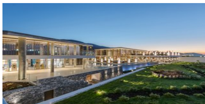
Blick auf die Anlage