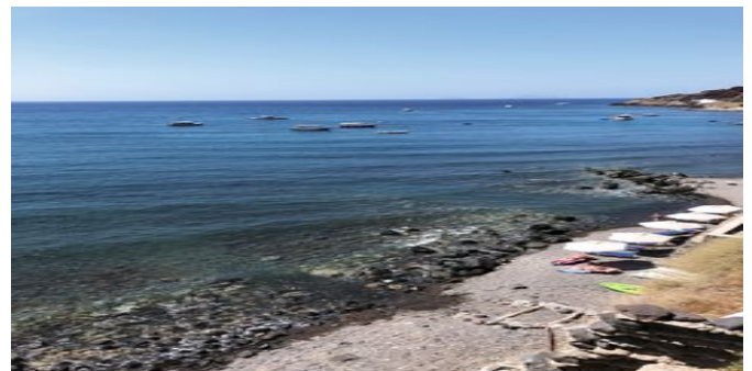
Der Strand bei der Anlage