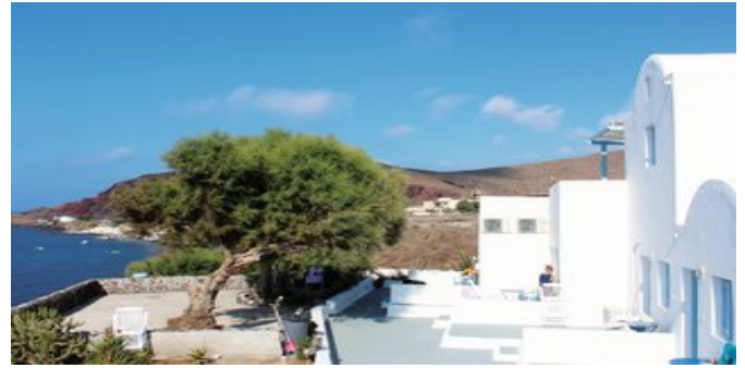
Das Hotel Akrotiri

ATTIKA SERVICE Deutschsprachige Reiseleitung. Transfer bei Pauschalreise inklusive.