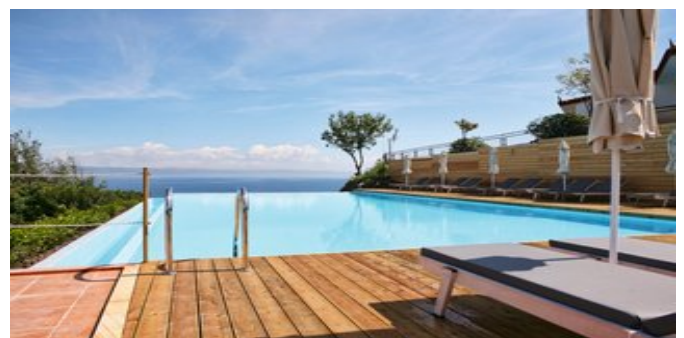
Einer der Pools