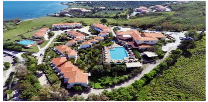
Blick auf das Hotel Belvedere

STRAND Etwa 250 m langer, naturbelassener steil abfallender Kiesstrand, teilweise befinden sich Felsplatten/Steine im Wasser. Stranddusche,