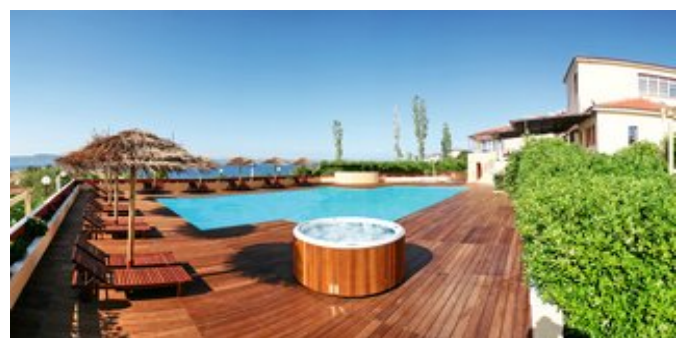
Einer der Pools