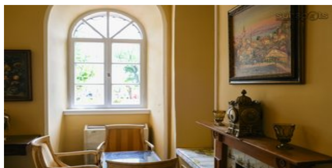
Der Aufenthaltsbereich mit Bar