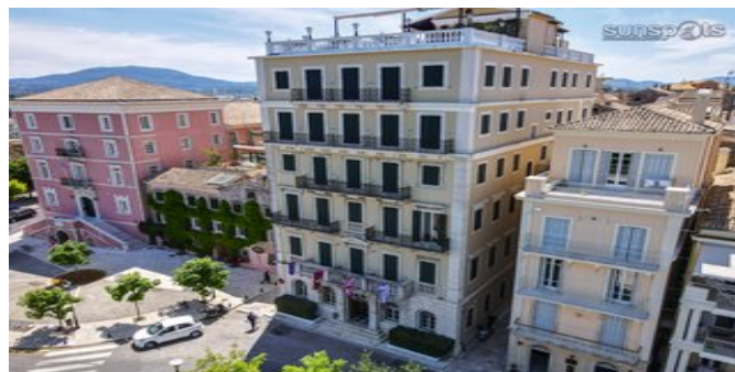
Das Cavalieri Hotel

SPARTIPP Bei Buchung eines Attika Mietwagens Transfergutschrift ab/bis Flughafen EUR 36 pro Person. Einen Mietwagen der Kat. A1 erhalten Sie