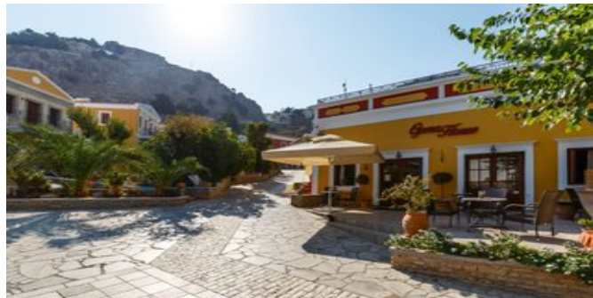
Das Hotel Opera House