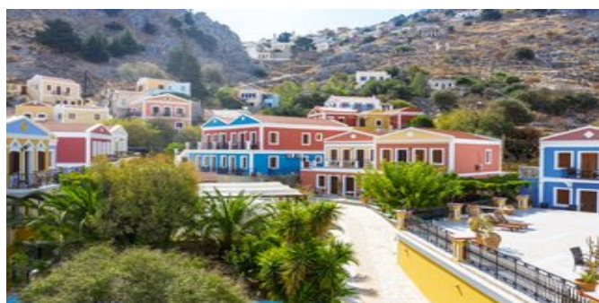
Blick auf das Hotel Opera House