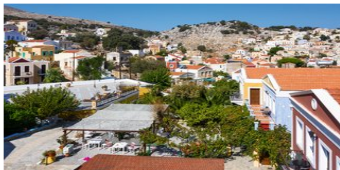
Blick über die Anlage und Gialós