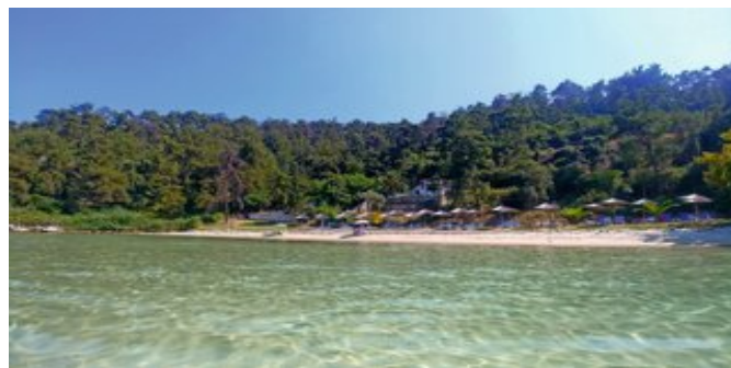
Der Strand Glyfáda

SPARTIPP Bei Buchung eines Attika Mietwagens ab/bis Flughafen Transfergutschrift EUR 70 pro Person. Einen Mietwagen der Kat. A1 erhalten Sie schon ab EUR 140 pro Woche.