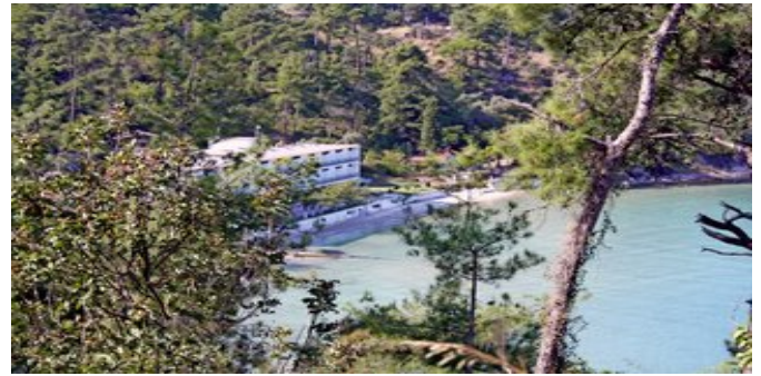
Blick auf das Hotel Glyfada