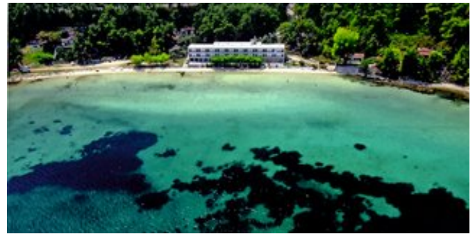
Das Hotel Glyfada