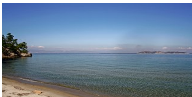
Der Strand Glyfáda