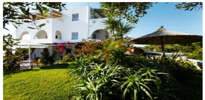
Das Hotel Evi Rooms