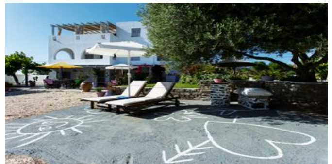
Die Evi Rooms