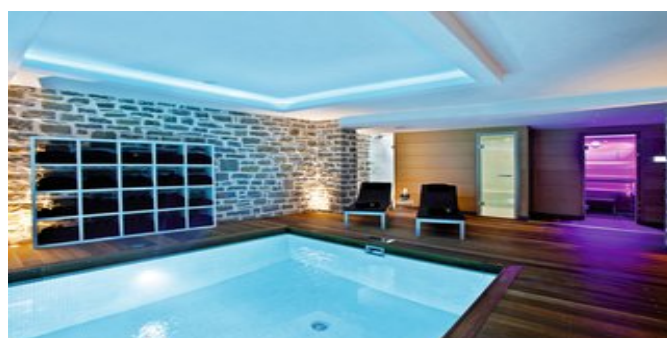
Im Spa Bereich