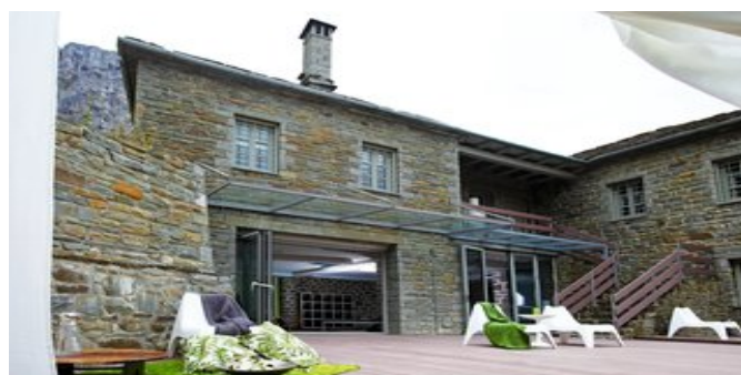
Der Spa Bereich