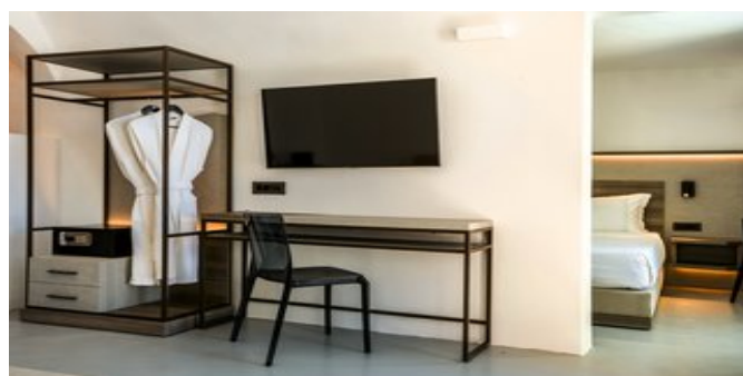
Wohnbeispiel Exclusive Cave Suite