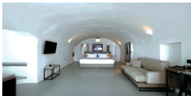
Wohnbeispiel Honeymoon Suite