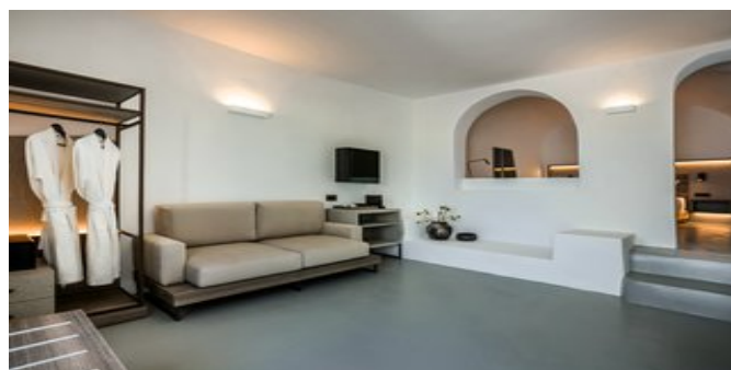
Wohnbeispiel Luxury Suite