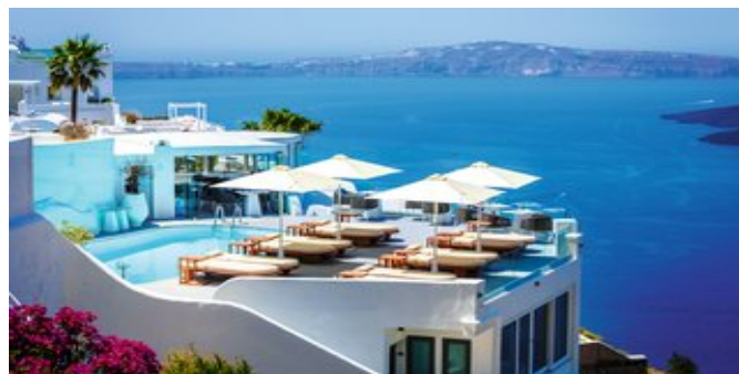
Blick über den Poolbereich

EXCLUSIVE CAVE SUITEN (UH) Ca. 35-40 qm. Für 2 Personen. Großer Schlafbereich mit Sitzgelegenheit. Grundausstattung wie die Superior Deluxe Zimmer. Dusche/WC, Föhn,