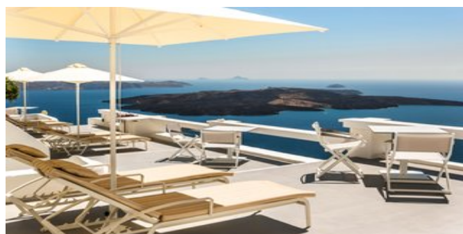
Blick über die Sonnenterrasse