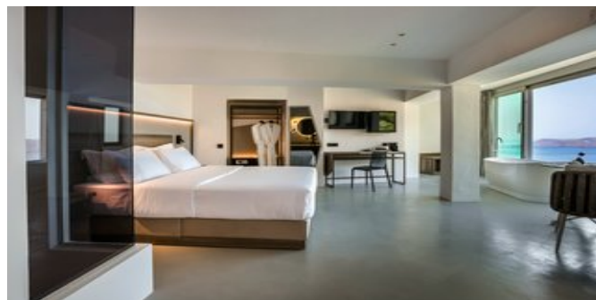
Wohnbeispiel Experience Suite