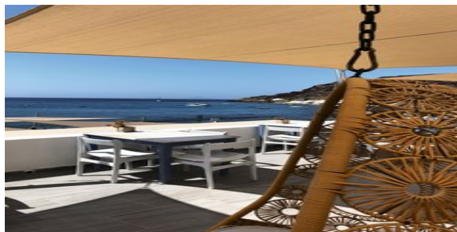
Blick auf die Terrasse