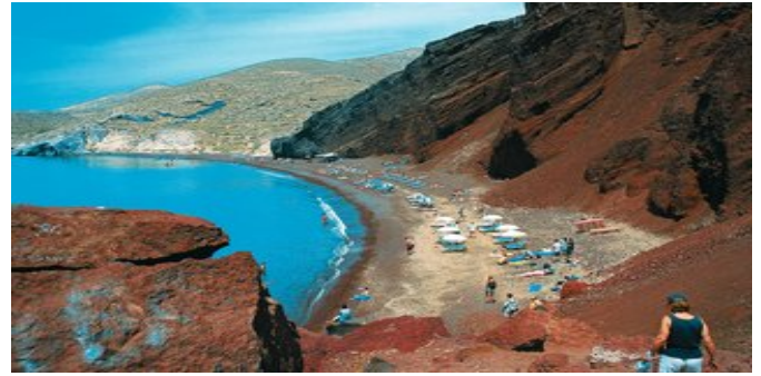
Der Rote Strand