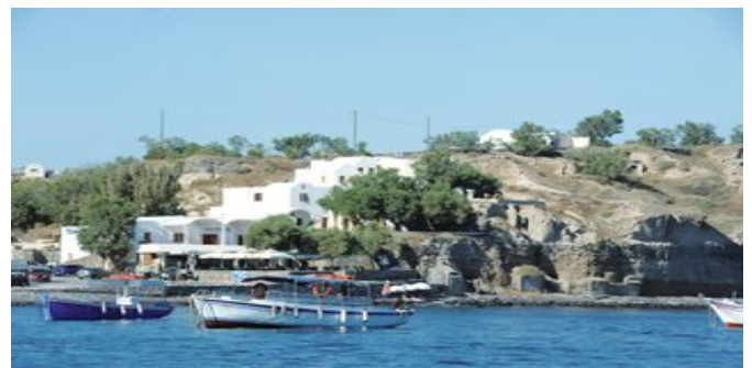
Blick auf das Hotel