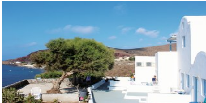
Das Hotel Akrotiri

SPARTIPP Bei Buchung eines Attika Mietwagens ab/bis Flughafen Transfergutschrift EUR 38 pro