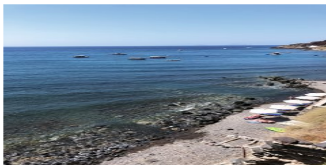
Der Strand bei der Anlage