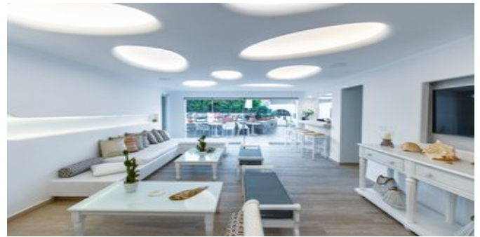
Im Hotel Spiros