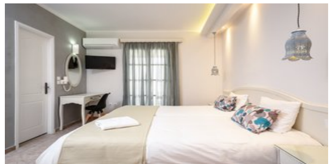
Wohnbeispiel Junior Suite