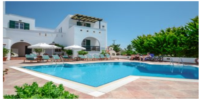
Das Hotel Spiros

HOTELCHARAKTER Kleines, reizendes, familiär