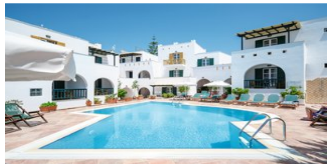
Das Hotel Spiros