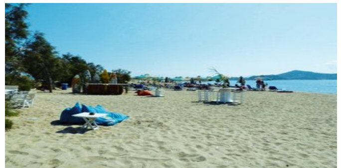
Der Strand von Aghios Geórgios