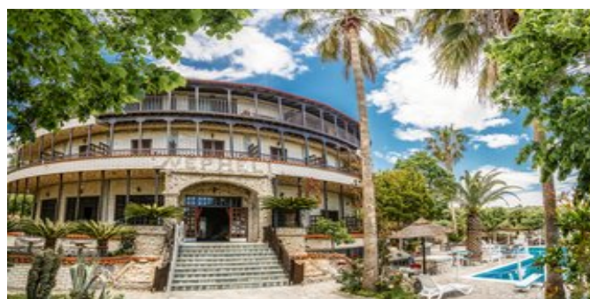
Das Nepheli Hotel