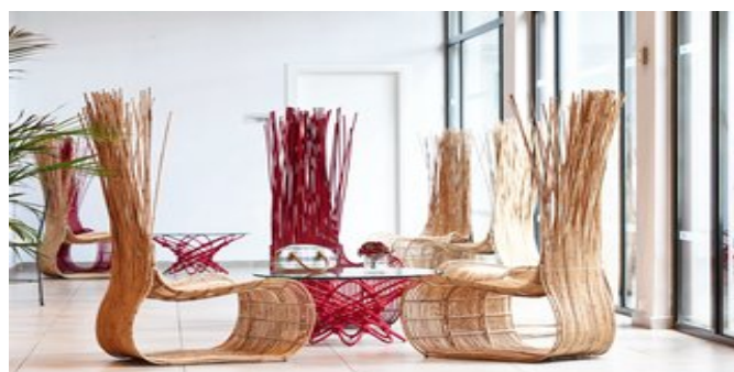
In der Lobby