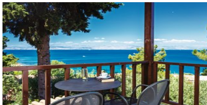
Blick auf das Meer

VERPFLEGUNG AI (Frühstück, Mittag- und Abendessen in Buffetform mit Show-Kochen, spezielles Kinderbuffet). Zu den Mahlzeiten lokales Bier und Wein, Softgetränke und Säfte. 5-mal wöchentlich Themenabende (asiatisch, mediterran, griechisch) und Fischabend. Food Court mit 2 Kiosken für Snacks, Kaffee und Kuchen sowie Eis von 11.00-17.00 Uhr und italienisches Strandbuffet-Restaurant von 12.00-15.30 Uhr. Lokale alkoholische Getränke und Cocktails, Bier, Wein sowie Softgetränke von 10.30-23.00 Uhr an den dafür vorgesehenen Bars. Möglichkeit, im À-la-carte Restaurant das spezielle Table d'Hote Menü als Abendessen einzunehmen (Reservierung erforderlich), zusätzlich steht die "Griechische Taverne" mit Terrasse für Frühstück und Abendessen (1-mal pro Woche ohne Aufpreis) zur Verfügung (jeweils Reservierung erforderlich). Das Tragen von Armbändern bei All-inclusive-Gästen ist