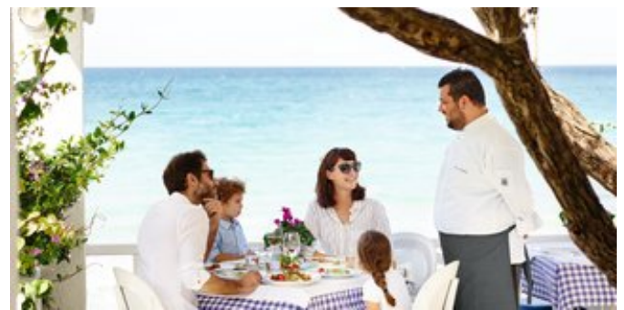
In der Ouzerie