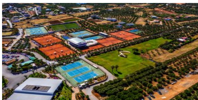
Außenanlage mit Tennisplätzen