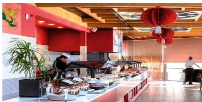
Restaurant mit Buffet