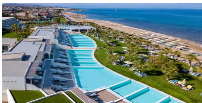
Außenansicht mit Pool