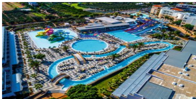
Anlage mit Poolbereich

JUNIOR SUITEN SEA FRONT PRIVATER POOL (UC) Ca. 25 qm. Für 2 Erwachsene und 1 Kind. Grundausrüstung wie die Zimmer. Wohn-/Schlafraum mit Doppelbett sowie Sitzecke mit Schlafsofa. Walk-In Regendusche/WC, Föhn, Bademantel, Slipper, Pooltücher. Terrasse an der