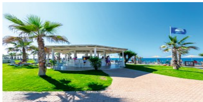
Gartenanlage mit Bar

SUITEN SEA FRONT MIT GEMEINSCHAFTSPOOL (UF) Ca. 40 qm. Für 3 Erwachsene und 1 Kind. Grundausrüstung wie die Zimmer. Zwei Schlafbereiche mit Doppelbett und 2 Einzelbetten. Walk-In Regendusche/WC, Föhn,