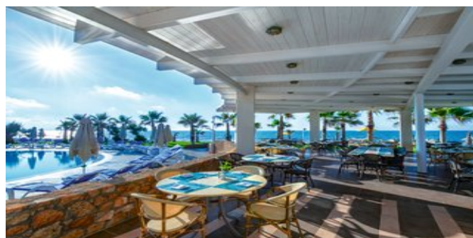
Restaurant mit Blick auf den Pool