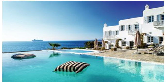
Blick auf den Pool und das Meer

SPARTIPP Bei Buchung eines Attika Mietwagens ab/bis Flughafen Transfergutschrift EUR 38 pro Person. Einen Mietwagen der Kat. A1 erhalten Sie schon ab EUR 140 pro Woche.