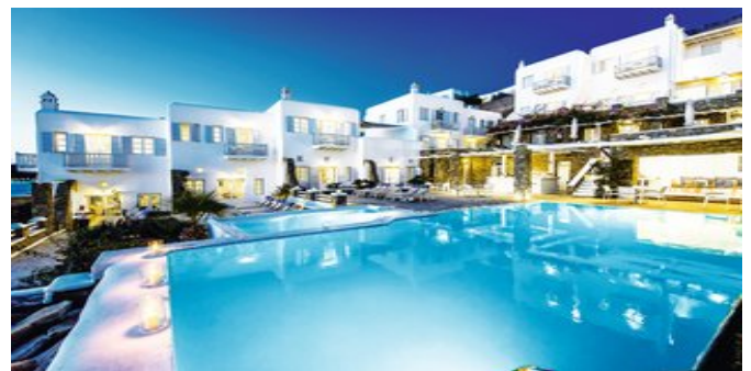
Blick auf den Pool und die Anlage