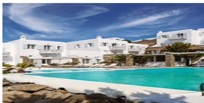
Das Apanema Resort