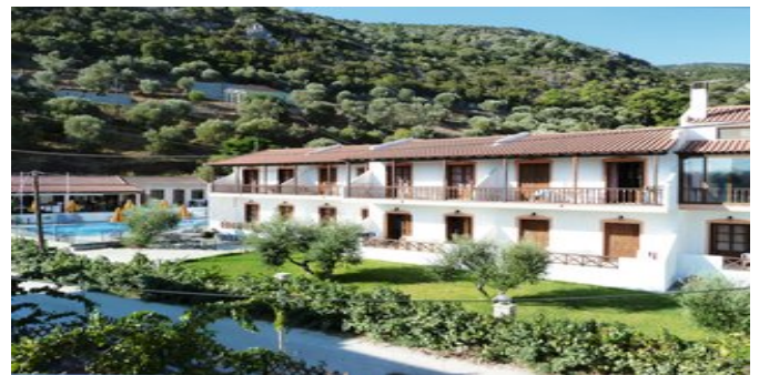
Die Anlage Sun Waves