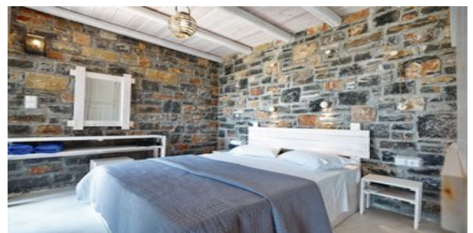
Wohnbeispiel Villa 1 Schlafzimmer