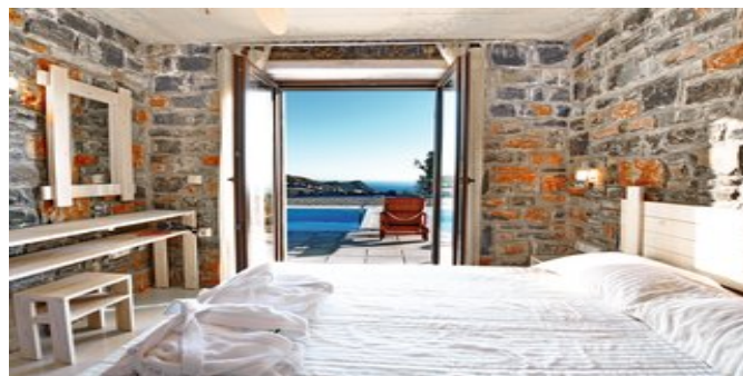
Wohnbeispiel Villa 2 Schlafzimmer