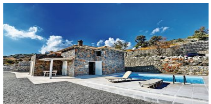
Die Palazzo Greco Villas