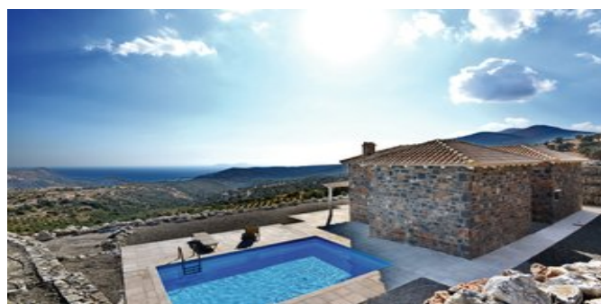
Blick über die Anlage zum Meer