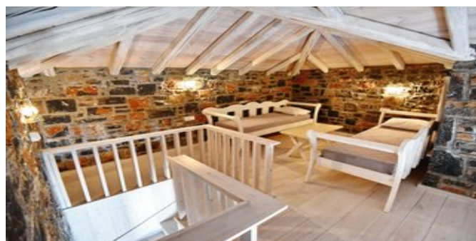
Wohnbeispiel Villa 2 Schlafzimmer