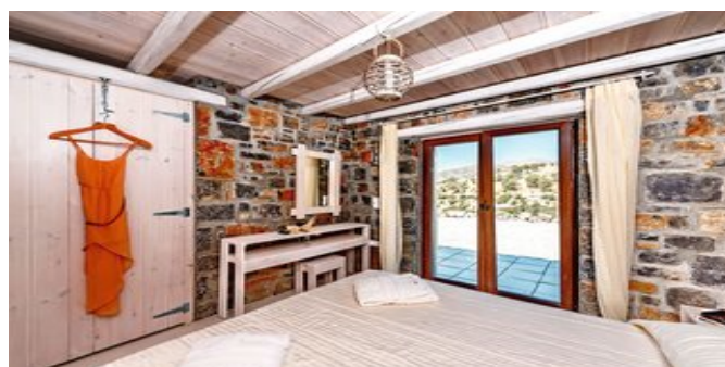
Wohnbeispiel Villa 1 Schlafzimmer