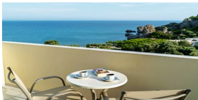
Auf dem Balkon