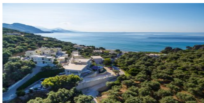
Blick auf das Hotel Polyrizos