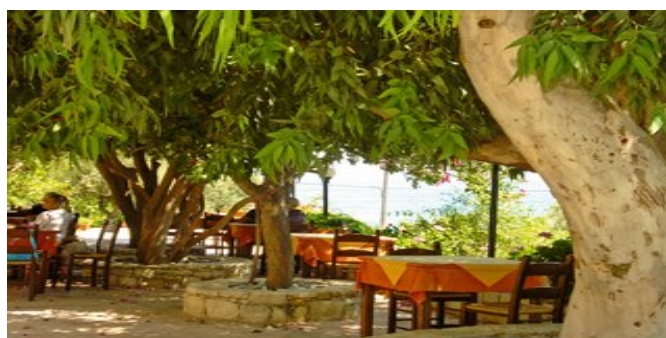
Die Terrasse der Taverne