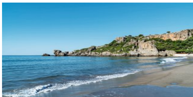
Der Strand beim Hotel