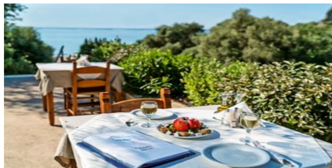
Auf der Terrasse

ATTIKA SERVICE Deutschsprachige Reiseleitung.