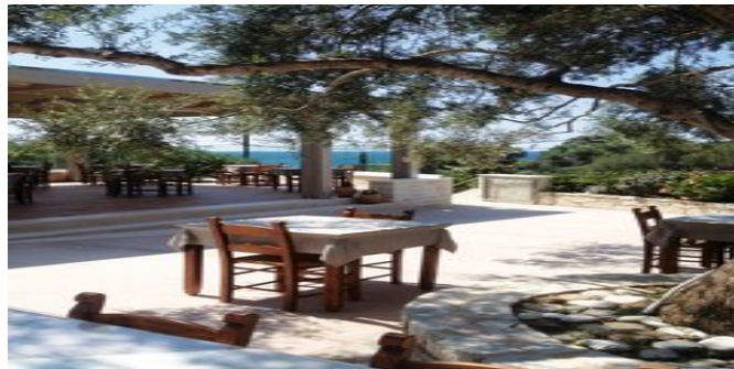
In der Taverne