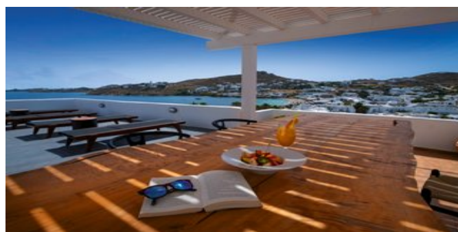
Blick von der Terrasse