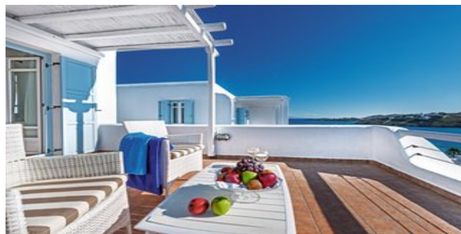
Zeit zum Relaxen

JUNIORSUITEN (UA) Ca. 31-35 qm. Für 2-3 Personen. Lage im 2. und 3. Stockwerk. Grundausstattung wie die Superiorzimmer, jedoch geräumiger, mit Sofabett für die 3. Person. Bad/WC, Föhn. Balkon oder Terrasse mit Jacuzzi und Meerblick.